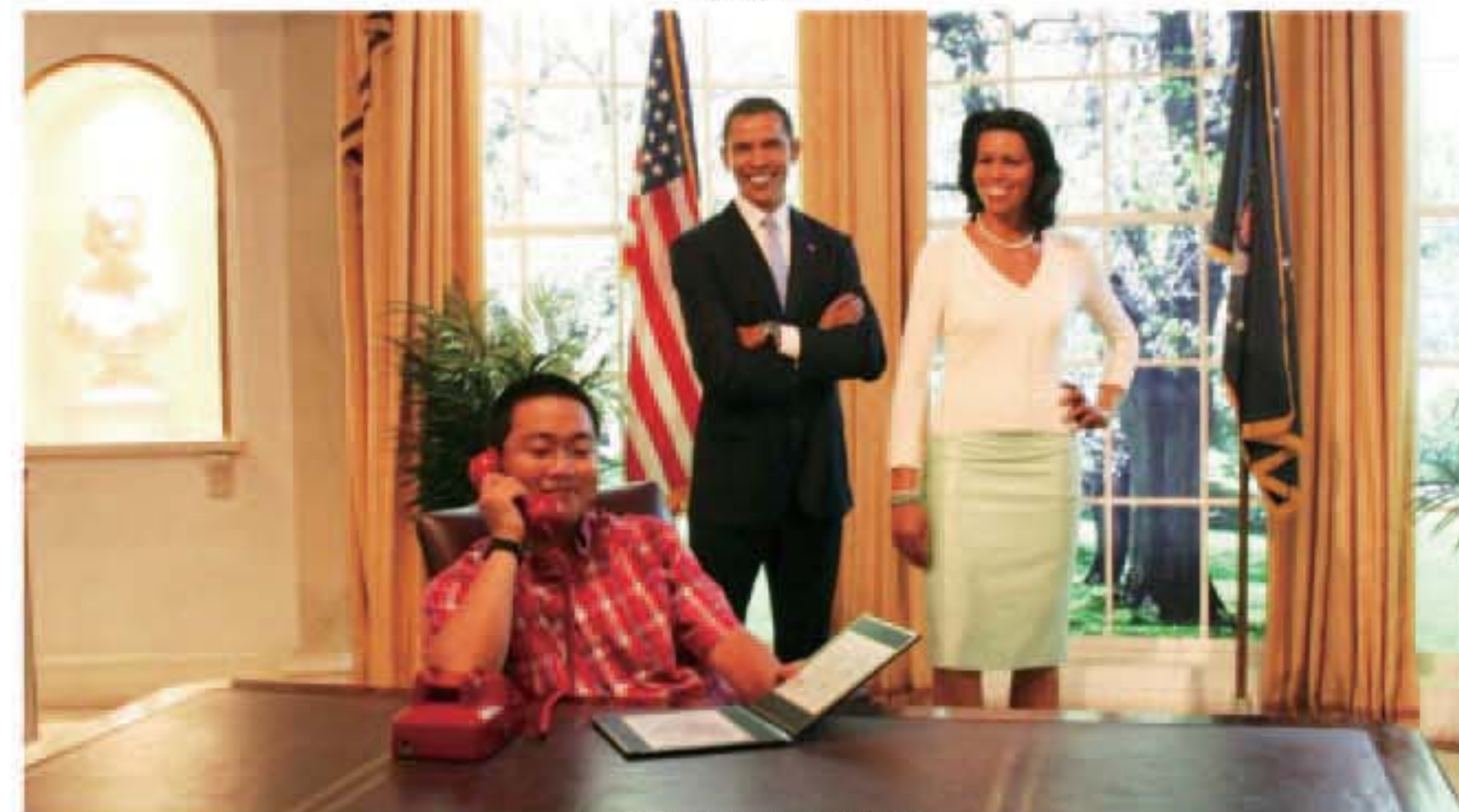
我在纽约杜莎夫人蜡像馆